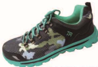
col.メイサイ/エメラルド