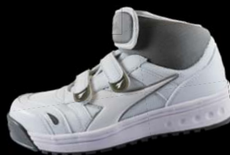
AT-112C (ホワイトxホワイト)