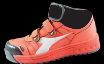
AT-812C (ピーチオレンジxホワイト)