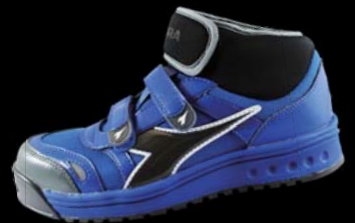
AT-422C (ロイヤルブルーxブラック)