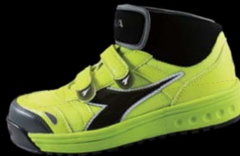
AT-522C (ライトイエローxブラック)